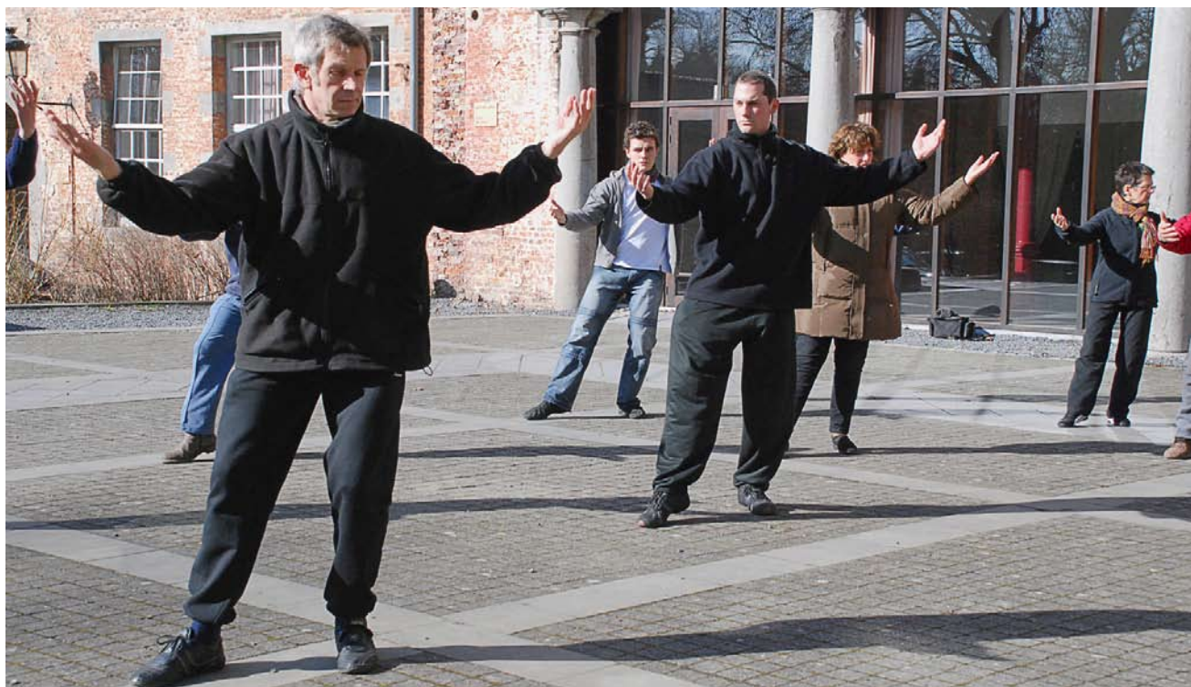
Yang traditionnel (40 postures) - Saint-Denis, avril 2008

Dates : 19-20 décembre 2009, 13-14 février 2010, 27-28 mars 2010 (Abbaye de Saint-Denis) 19-20 juin 2010 (résidentiel à Battincourt)